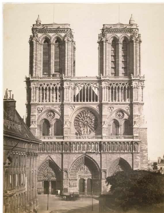
Édouard Baldus, Cathédrale Notre-Dame, façade ouest , 1857