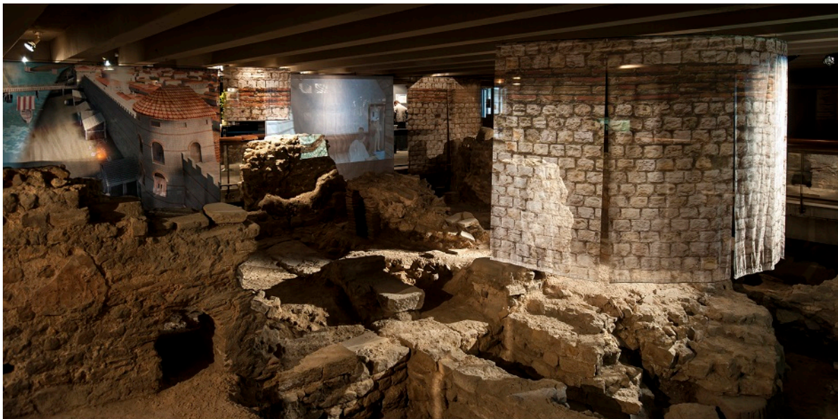
La Crypte archéologique de l'île de la Cité